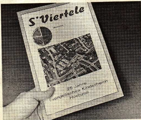
S' Viertele – viel Lesestoff für das evangelische Kinderheim Hochzoll.

Das Heft schildert ungeschminkt in Interviews die Schwierigkeiten und Chancen auf dem Weg ins selbständige Erwachsenenleben. Manchen wird dabei über das betreute Einzelwohnen geholfen. Schon früher fällt die klassische Heim-Atmosphäre weg.